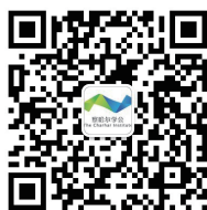
察哈尔学会微信二维码

“一带一路”沿线国家发展差距甚大，找到各国发展战略的交集是“一带一路”建设的主导方式。发展战略最大的交集是什么呢？就是现代化为目标和内容的国家战略！如何相互对接呢？需要找到一个“接口”！这个“接口”就是“共同现代化”。