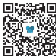
冲突与和解微信二维码